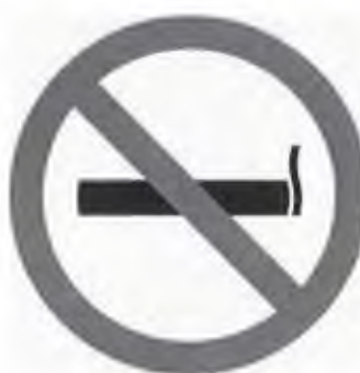
TILOS A DOHÁNYZÁS

SMOKING AREA ZONE FUMEUR RAUCHERZONE МЕСТО ДЛЯ КУРЕНИЯ