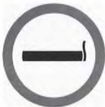
DOHÁNYZÁSRA KIJELELT HELY

SMOKING AREA ZONE FUMEUR RAUCHERZONE МЕСТО ДЛЯ КУРЕНИЯ